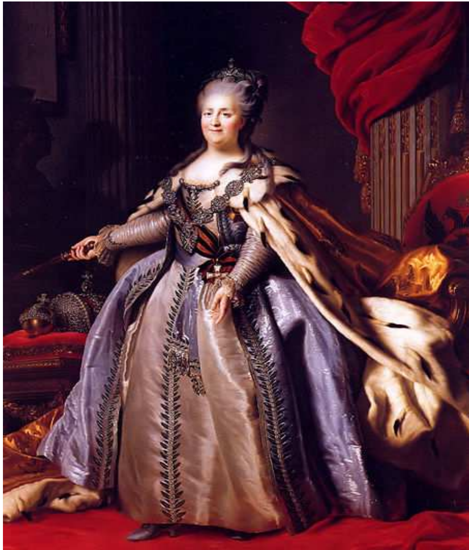
Katarzyna II Wielka Cesarzowa Rosji

23 stycznia 1793 roku doszło do podpisania traktatu podziałowego między Cesarzową Katarzyną II, a Królem Fryderykiem Wilhelmem II. Po podpisaniu Wojska Pruskie, dowodzone przez Joachima Heinricha von Möllendorfa — weszły do Wielkopolski, a rosyjskie do wschodniej Polski. Z kolei 25 marca 1793 roku król pruski wydał patent inkorporacyjny, w którym wezwał pod groźbą kary wszystkich mieszkańców zajętych przez wojska pruskie ziem do złożenia hołdu (homagium).