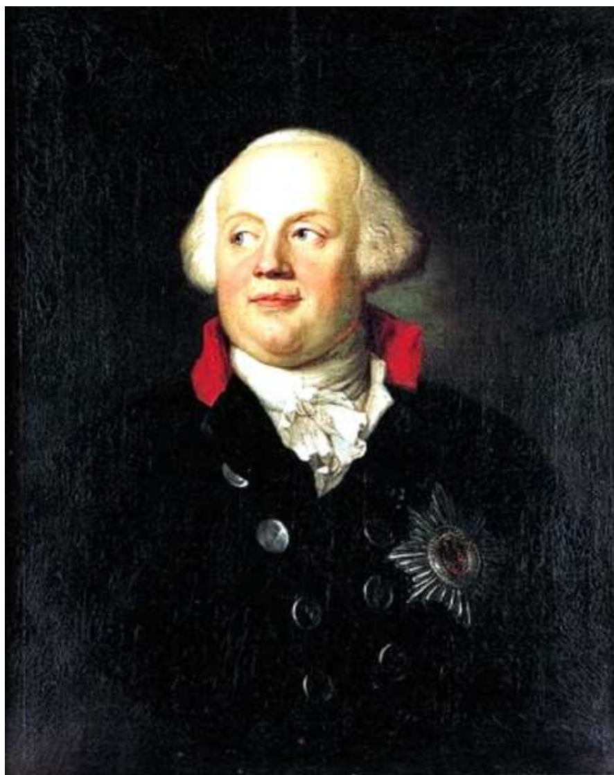
Fryderyk Wilhelm II Król Prus

Wykorzystując kapitulację Stanisława Augusta Poniatowskiego wobec Rosji i przejęcia rządów w kraju przez targowiczán – król pruski Fryderyk Wilhelm II zażądał wcielenia Wielkopolski do Królestwa Prus.