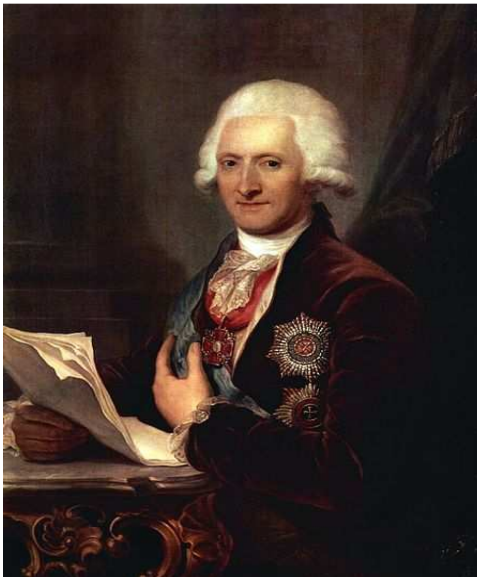
Posel rosyjski Jakob Siebers

9 kwietnia 1793 roku poseł rosyjski Jakob Sievers i pruski Ludwig Heinrich Buchholtz przedłożyli w Grodnie Generalności konfederacji targowickiej manifest dworów sprzymierzonych, żądając zwołania sejm w celu przeprowadzenia rozbiórów. Wskrzyszona przez targowiczów Rada Nieustająca, obsadzona zausznikami Sieversa wydała uniwersał zwołujący sejm, które Stanisław August Poniatowski miał podpisać 3 maja 1793 roku.