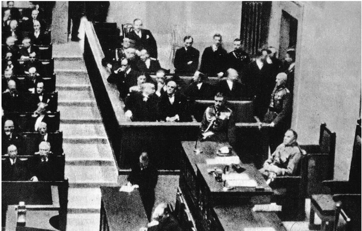
Piłsudski podczas otwarcia sesji Sejmu w 1928 roku

W wyborach parlamentarnych z 4 marca 1928 BBWR zwyciężył, uzyskując ok. 25% głosów, otrzymując 130 mandatów w Sejmie i 46 w Senacie (na 111). 13 marca, podczas spotkania z grupą posłów Bloku, Piłsudski opisał swoją wizję dalszych rządów, podczas których gabinet miał zajmować pozycję uprzywilejowaną względem parlamentu. Marszałek odrzucał koncepcję monopartyjności, a nową konstytucję uważał za wciąż odległą perspektywę.