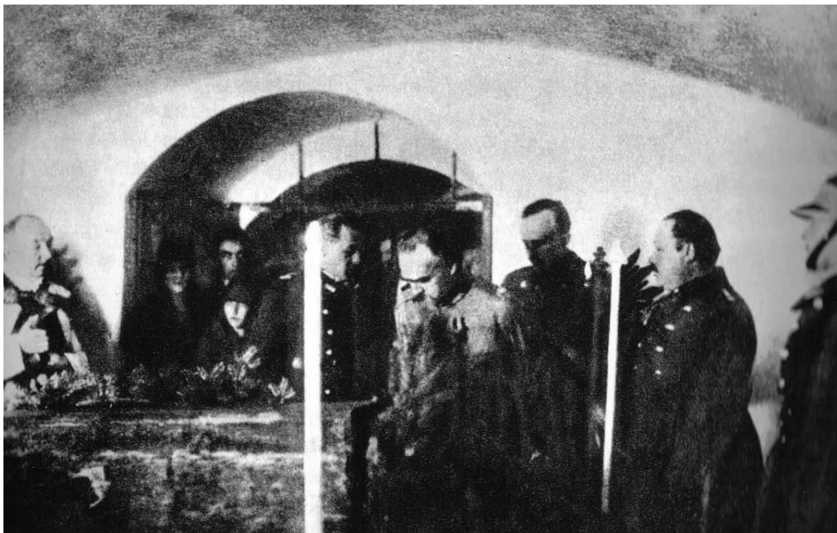
Piłsudski podczas wizyty na zamku w Nieświeżu udekorował orderem Virtuti Militari sarkofag swego adiutanta, Stanisława Radziwiłła, poległego w 1920 roku.

Skład rządu: premier – marszałek Józef Piłsudski, wicepremier – Kazimierz Bartel, minister spraw wewnętrznych – Felicjan Składkowski, minister spraw zagranicznych – August Zaleski, minister spraw wojskowych – marszałek Józef Piłsudski, minister sprawiedliwości – Aleksander Meysztowicz, minister wyznań religijnych i oświecenia publicznego – Kazimierz Bartel – kierownik, minister skarbu – Gabriel Czechowicz, minister przemysłu i handlu – Eugeniusz Kwiatkowski, minister rolnictwa i dóbr państwowych – Karol Niezabytowski, minister reform rolnych – Witold Staniewicz, minister robót publicznych – Jędrzej Moraczewski, minister pracy i opieki społecznej – Stanisław Jurkiewicz, minister komunikacji – Paweł Romocki. W okresie funkcjonowania rządu nastąpiła jedna zmiana. 9 stycznia 1927 roku utworzono Ministerstwo Poczty i Telegrafów, ministrem został Bogusław Miedziński, odwołano z funkcji kierownika w Ministerstwie Wyznań Religijnych i Oświecenia Publicznego Kazimierza Bartla, jego miejsce jako minister zajął Gustaw Dobrucki. 26 października 1926 na zamku w Nieświeżu Piłsudski spotkał się z przedstawicielami polskiej arystokracji.