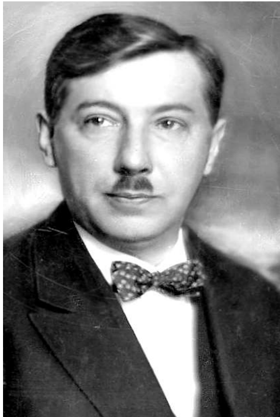
Eugeniusz Kwiatkowski – Wicepremier i Minister Skarbu

(COP) – okręg przemysłowy przemysłu ciężkiego o powierzchni 60.000 km 2 (44 powiaty) i zamieszkały przez 6 mln ludzi, budowany w 1936–1939 w południowo-centralnych dzielnicach Polski. Był jednym z największych przedsięwzięć ekonomicznych II Rzeczypospolitej. Celem COP-u było zwiększenie ekonomicznego potencjału Polski, rozbudowa przemysłu ciężkiego i zbrojeniowego, a także zmniejszenie bezrobocia wywołanego skutkami wielkiego kryzysu. Zakłady COP zapewniły pracę na terenach dotkniętych największym bezrobociem, a budowa infrastruktury towarzyszącej podniosła poziom cywilizacyjny tych terenów. Na rozwój COP-u przeznaczono w latach 1937–1939 około 60% całości wydatków inwestycyjnych o łącznej wartości 1925 mln zł.