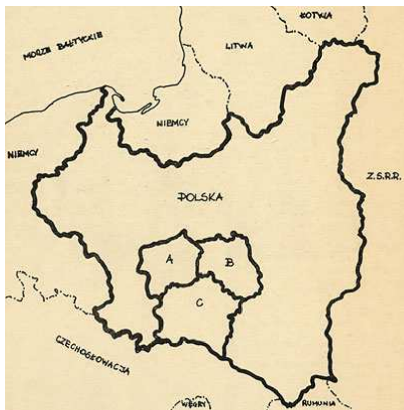
Położenie COP na mapie II Rzeczypospolitej

Najważniejsza część okręgu położona była w widłach Wisły i Sanu z centrum w Sandomierzu. Rejon ten położony na granicy Polski A i B utożsamiany był właściwie z całym okręgiem ze względu na znaczną liczbę zakładów przemysłowych. W 1939 roku planowano