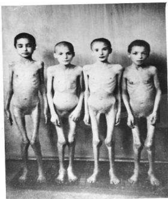
Dzieci będące przedmiotem eksperymentów dr Jozefa Mengele