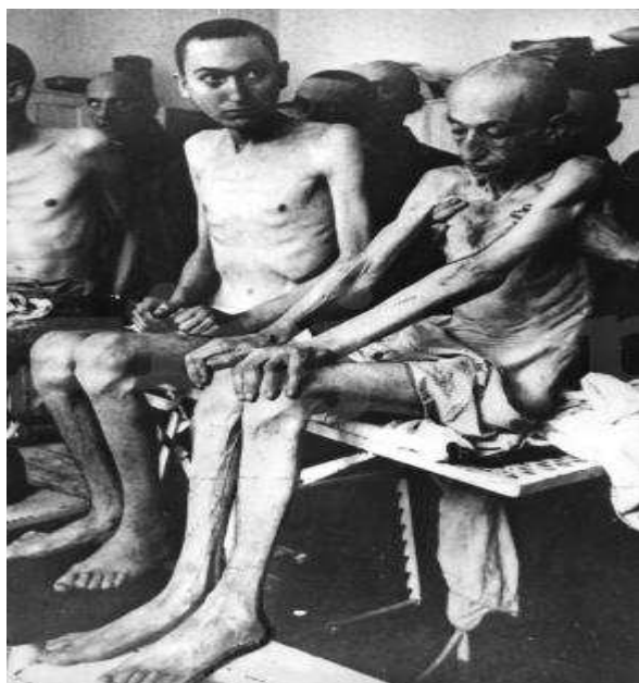
Luty 1945. Więźniowie obozu koncentracyjnego Auschwitz.

Komendant KL Auschwitz Rudolf Hoess po klęsce Niemiec ukrywał się pod nazwiskiem Franza Langer w brytyjskiej strefie okupacyjnej. 11 lutego 1946 r. został rozpoznany i aresztowany, a następnie wydany Polsce, gdzie wyrokiem Najwyższego Trybunału Narodowego skazano go na śmierć. 16 kwietnia 1947 r. został powieszony w byłym KL Auschwitz, obok budynku komendatury, w której urzędował