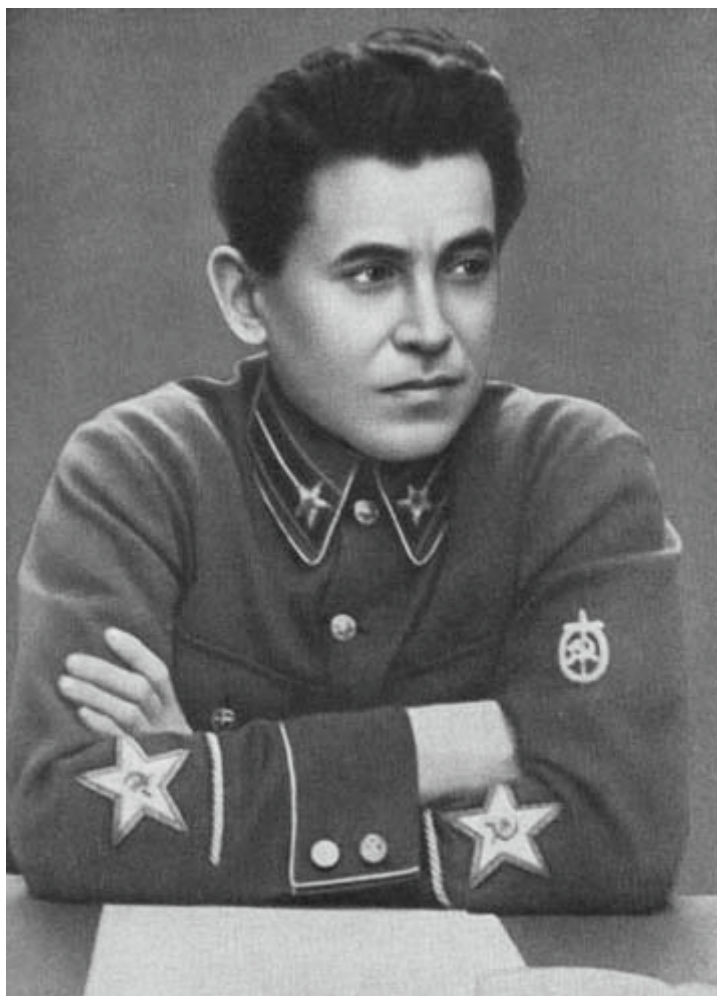
NIKOLAJ JEŻOW KOMISARZ LUDOWY NKWD

Antypolska operacja Ludowego Komisariatu Spraw Wewnętrznych Związku Socjalistycznych Republik Radzieckich była jedną z zaplanowanych ludobójczych operacji tego komisariatu ludowego przeprowadzonych, w czasie „Wielkiego terronu”, którego ofiarą padło w latach 1936–1938 co najmniej 8 milionów obywateli ZSRR. Była to jednocześnie operacja NKWD, dotycząca zbiorowo (w formie oficjalnej) największej liczby członków konkretnej narodowości, w tym wypadku polskiej. Akcja objęła wszystkich Polaków, bez względu na przynależność klasowo-społeczną, decydowała narodowość. Wśród zamordowanych i deportowanych byli: