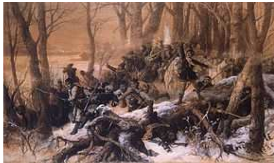
„Walka powstańcza” Michał Elwiro Andriolli

Powstanie Styczniowe było największym polskim powstaniem narodowym, spotkało się z poparciem międzynarodowej opinii publicznej. Miało charakter wojny partyzanckiej, w której stoczono ok. 1200 bitew i potyczek. Mimo początkowych sukcesów zakończyło się klęską powstańców.