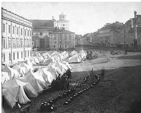
Biwak armii rosyjskiej na Placu Zamkowym w Warszawie po wprowadzeniu stanu wojennego w Królestwie Polskim w 1861 roku