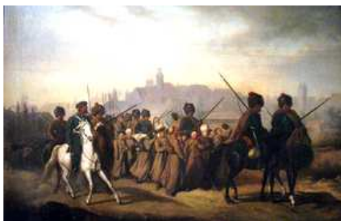
Aleksander Sochaczewski Branka 1863

Margrabia Aleksander Wielopolski, jako naczelnik rządu cywilnego Królestwa Polskiego od czerwca 1862 r., był świadomy istnienia niepodległościowych ruchów w kraju, w połowie stycznia 1863 r. zarządził niespodziewany pobór do wojska rosyjskiego (tzw. brankę). Przygotowane zostały w tym celu imienne listy, obejmujące 12 tys. osób, podejrzanych o przynależność do organizacji patriotycznych. Władze pobór z premedytacją skierowały przeciwko szlachcie i mieszczaństwu z pominięciem ludności wiejskiej, co było bezpośrednią przyczyną wybuchu Powstania Styczniowego.