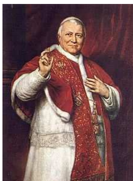
Papież Pius IX

Po upadku powstania Kraj i Litwa pogrążyły się w żałobie narodowej. W roku 1867 zniesiono autonomię Królestwa Polskiego, jego nazwę i budżet, w 1869 zlikwidowano Szkołę Główną Warszawską, w latach 1869–1870 setkom miast wspierających powstanie odebrano prawa miejskie doprowadzając je tym samym do upadku, w roku 1874 zniesiono urząd namiestnika, w 1886 zlikwidowano Bank Polski. Skasowano 114 klasztorów katolickich w Królestwie, zlikwidowano znaczną liczbę szkół, skonfiskowano ok. 1600 majątków ziemskich i rozpoczęto intensywną rusyfikację ziem polskich. Po stłumieniu powstania znaczna część społeczeństwa Królestwa i Litwy uznała dalszą walkę zbrojną z zaborcą rosyjskim za bezcelową i zwróciła się ku pracy organicznej. Stolica Apostolska bardzo ostro wystąpiła przeciwko Rosji broniąc polskiej narodowej sprawy. Papież Pius IX w mowie tronowej 24 kwietnia 1864 roku powiedział: „...sumienie mnie nagli abym podniósł głos przeciwko potężnemu mocarzowi, którego kraje rozciągają się aż do bieguna..... monarcha ten prześladuje z dzikim okrucieństwem Naród Polski i podjął dzieło bezbożne wytępienia religii katolickiej w Polsce..”