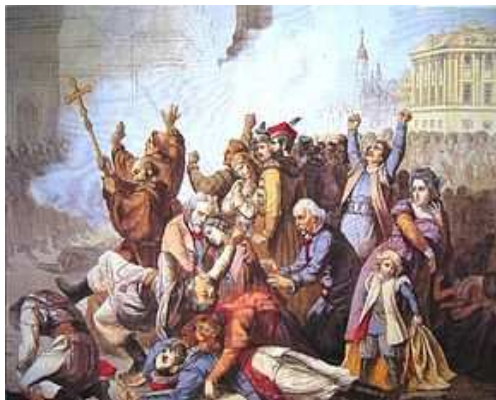
Wojsko rosyjskie strzela do manifestantów w Warszawie 8 kwietnia 1861 roku