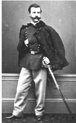
Gen. Marian Langiewicz

Traugutt został aresztowany przez rosyjską policję w nocy z 10 na 11 kwietnia 1864 w swojej warszawskiej kwaterze (został wydany przez Artura Goldmana). Początkowo przetrzymywany był na Pawiaku, a później więziono go w X Pawilonie Cytadeli Warszawskiej. Próbowano wydobyć z niego informacje dotyczące dowództwa powstania, jednak Traugutt nie wydał nikogo. W czasie jednego z przesłuchań miał wypowiedzieć słynne zdanie: „Idea narodowości jest tak potężną i czyni tak wielkie postępy w Europie, że ją nic nie pokona”. 5 sierpnia 1864 roku na stokach Cytadeli Warszawskiej zostali powieszeni