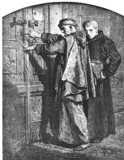
Zamknięcie kościołów – grafika Artura Grottgera

15 października, mimo zakazów warszawiacy wzięli udział w obchodach rocznicy śmierci Tadeusza Kościuszki, co skończyło się rozbiem manifestacji przez wojsko rosyjskie i porywaniem ludzi z kościołów. Wojska rosyjskie dowodzone przez wojskowego generała-gubernatora warszawskiego Aleksandra Daniłowicza Gerstenzweiga dokonały pacyfikacji ludności cywilnej zebranej w katedrze św. Jana w Warszawie. Na znak protestu przeciwko aresztowaniu 1878 wiernych w katedrze warszawskiej, do której wtargnęło wojsko, administratorzy diecezji nakazali zamknięcie wszystkich kościołów i kaplic w Warszawie.