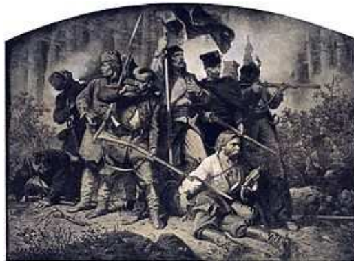
Bitwa – Artur Grottger