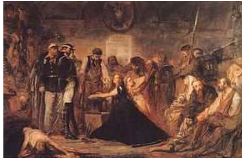
Polonia – Rok 1863 Obraz Jana Matejki z 1864 roku

Niemnem, Dąbrowska – Noce i dnie, Żeromski – Wierna rzeka) i sztuce (Grottger – Polonia i Lithuania, Matejko – Polonia) XIX i XX wieku w kraju, na Litwie i na Białorusi.