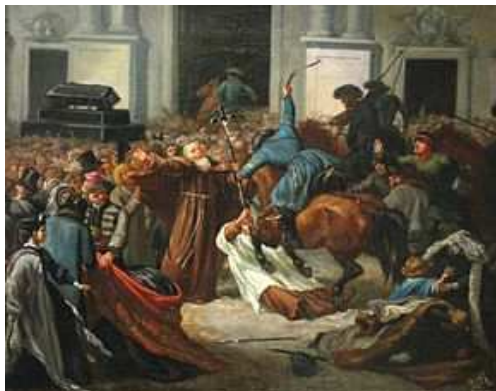
Kozacy atakują Kościół św. Anny w Warszawie 27 lutego 1861 roku

Po serii krwawo stłumionych manifestacji patriotycznych nowy rosyjski namiestnik gen. Karol hr. Lambert 14 października 1861 roku wprowadził stan wojenny w celu spacyfikowania Królestwa Polskiego.