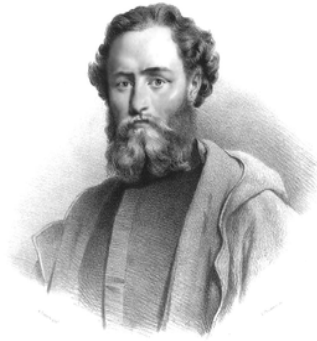
Gen. Ludwik Mierosławski

Powstanie Styczniowe było polskim powstaniem narodowym skierowanym przeciwko Imperium Rosyjskiemu, zostało ogłoszone manifestem 22 stycznia 1863 roku wydanym w Warszawie przez Tymczasowy Rząd Narodowy, spowodowane narastającym rosyjskim terrorem wobec polskiego biernego oporu. Wybuchło 22 stycznia 1863 w Królestwie Polskim i 1 lutego 1863 w byłym Wielkim Księstwie Litewskim, trwało do jesieni 1864. Najdłużej aż do grudnia 1863 roku walczył ostatni oddział powstańczy ks. gen. Stanisława Brzóska na Podlasiu. Zasięgiem objęło tylko zabór rosyjski: Królestwo Polskie oraz ziemie zabrane – Litwę, Białoruś i część Ukrainy. Wojskami powstańczymi kierowali kolejno dyktatorzy: gen. Ludwik Mierosławski (od 17 lutego do 11 marca 1863 roku), gen. Marian Langiewicz (od 11 marca do 18 marca 1863 roku) oraz Romuald Traugutt (od 17 października 1863 roku do 10 kwietnia 1864 roku).