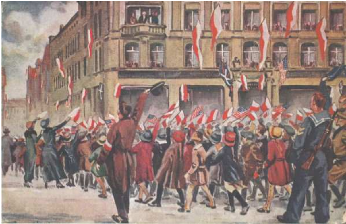
Hołd dzieci polskich złożony Ignacemu Janowi Paderewskiemu przed Bazarem w Poznaniu w piątek 27 grudnia 1918 roku