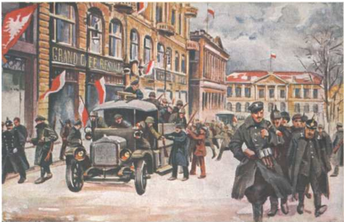
Żołnierze rozdają ludności cywilnej broń nawołując do przyłączenia się do walk wyzwoleniczych