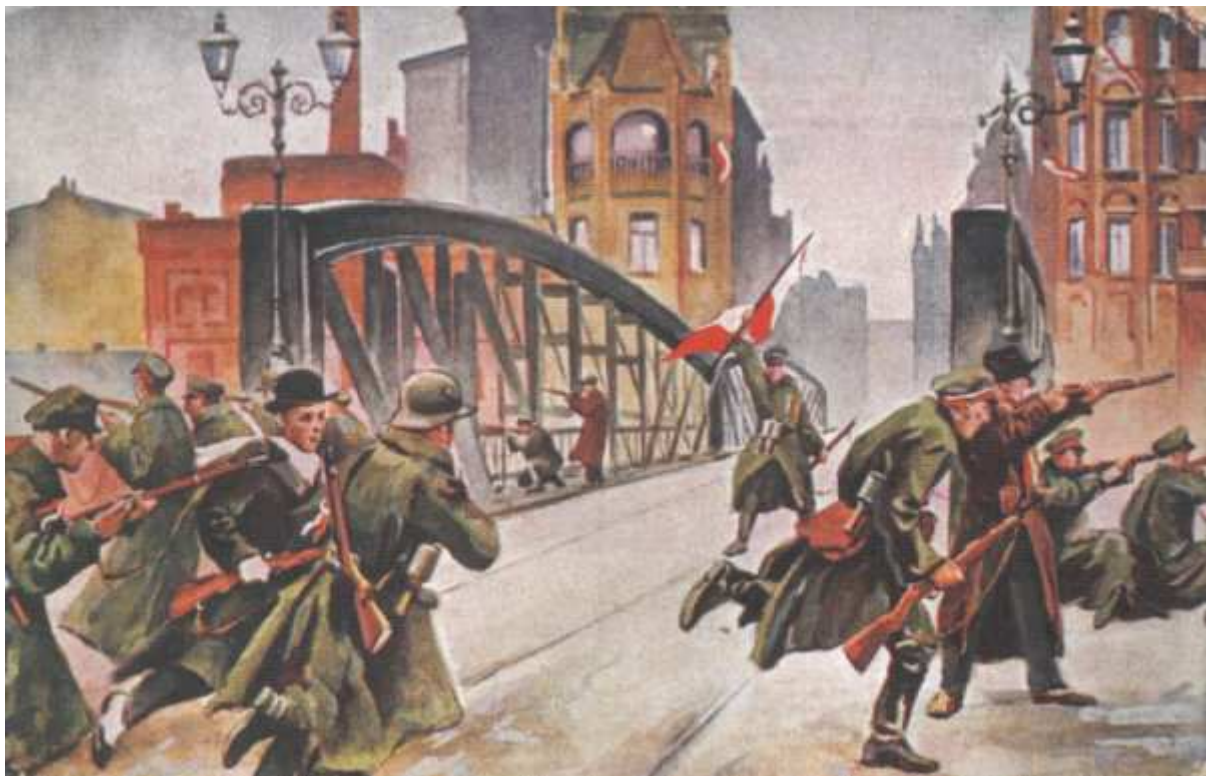
Walki na przedmieściach Poznania przed mostem Chwaliszewskim