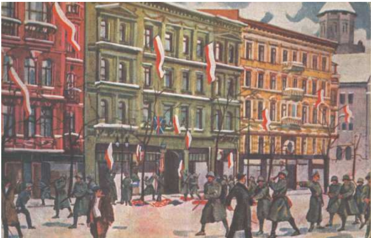
6 pułk grenadierów niemieckich zrywa flagi polskie i koalicyjne z siedziby Naczelnej Rady Ludowej w Poznaniu przy ul. Św. Marcina w piątek 27 grudnia 1918 roku