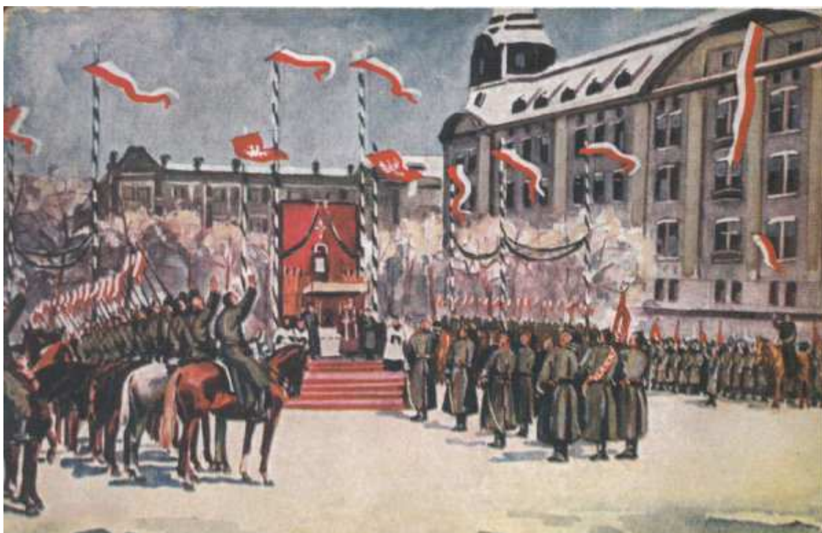
Przysięga wojsk polskich pod dowództwem gen. Józefa Dowbor-Muśnickiego w niedzielę 27 stycznia 1919 roku