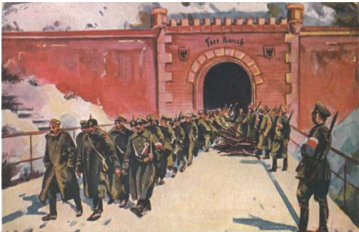
Scena rozbrojenia żołnierzy niemieckich w fortach poznańskich