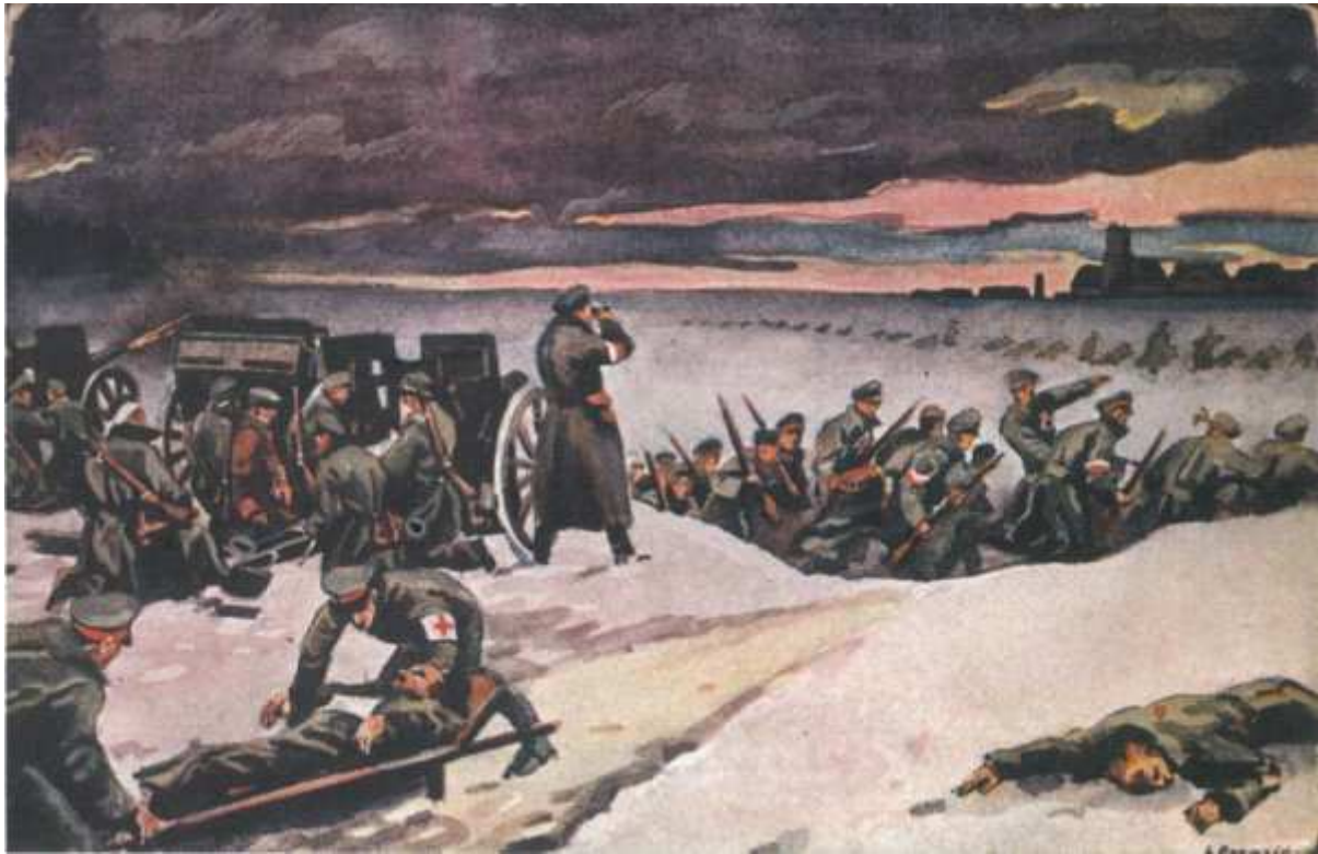
Scena nawiązująca do walk o zdobycie niemieckiego lotniska na Ławicy pod Poznaniem