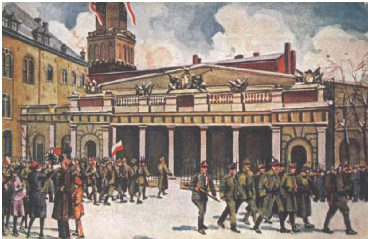
Odmarsz warty niemieckiej i wkroczenie polskiej na Głównym Odwachu na Starym Ryнку w Poznaniu