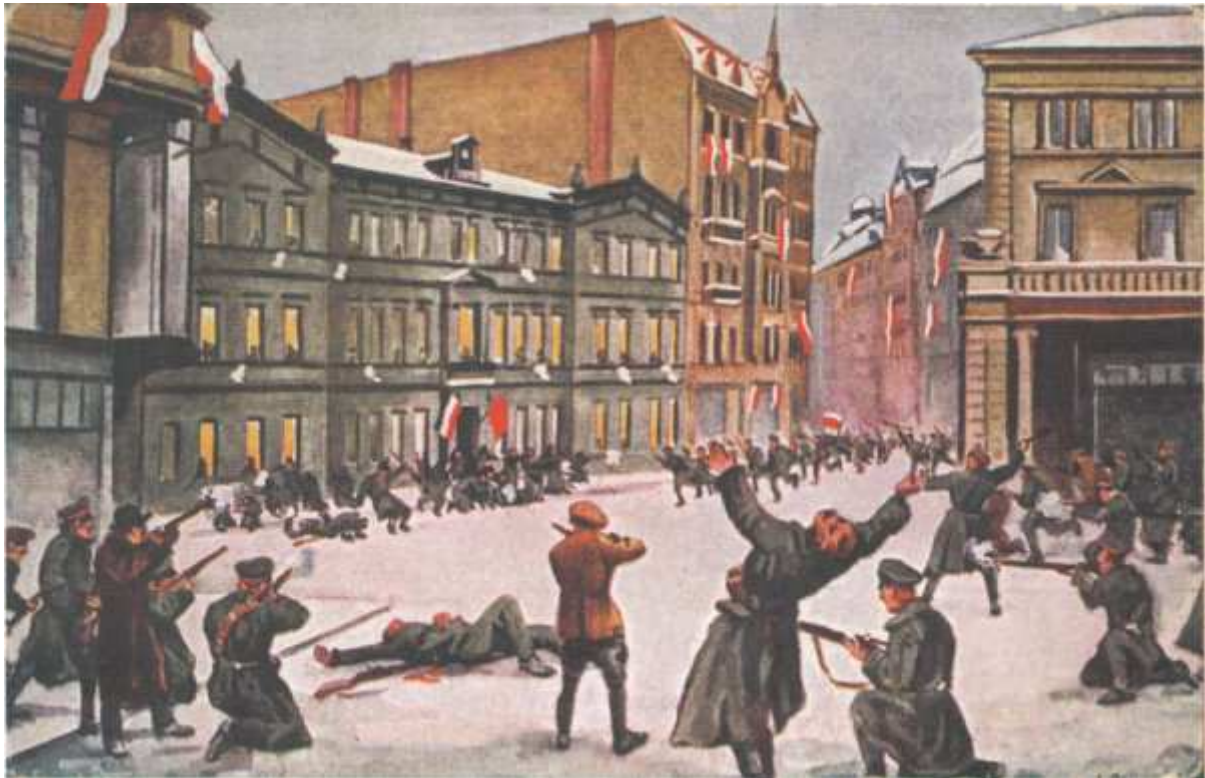
Szturm na Prezydium Policji – śmierć Franciszka Ratajczaka w piątek 27 grudnia 1918 roku