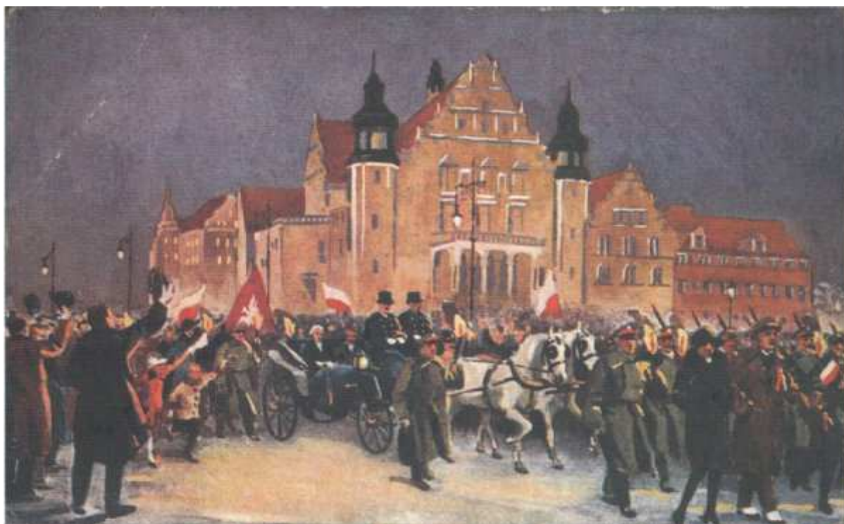
Przyjazd Ignacego Jana Paderewskiego do Poznania w towarzystwie oficerów angielskich w czwartek 26 grudnia 1918 roku