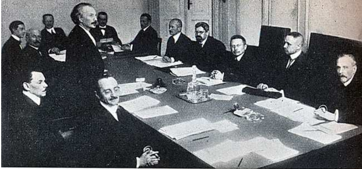
Rząd premiera Ignacego Paderewskiego

Wraz z Romanem Dmowskim jako delegat pełnomocny reprezentował Polskę na konferencji pokojowej w Paryżu, zakończonej podpisaniem traktatu wersalskiego, kończącego I wojnę światową w dniu 28 czerwca 1919 roku. Na mocy Traktatu Wersalskiego Polska odzyskała Wielkopolskę i Pomorze Gdańskie, a na terenie Górnego Śląska, Warmii i Mazur miały być przeprowadzone plebiscyty. Paderewskiemu nie udało się zrealizować wszystkich założeń strony polskiej, jednak dał się poznać jako sprawny negocjator i dyplomata. Pomimo to jego bezpartyjny rząd był krytykowany w kraju zarówno przez lewicę, jak i prawicę.