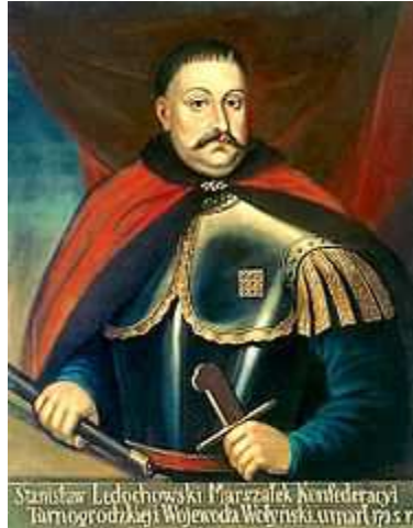
Marszałek Stanisław Ledóchowski

Wbrew powtarzanym w historiografii poglądom, Piotr I nie był gwarantem traktatu warszawskiego, do czego nie dopuścili król i konfederaci. W dodatku zobowiązał się wyprowadzić swoje wojska po uspokojeniu się w Polsce sytuacji wewnętrznej, co uczynił w 1719 roku. Po Sejmie niemym nastął 15-letni okres pokoju i odbudowy gospodarki.