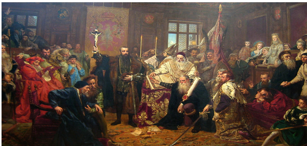
Unia Lubelska – obraz Jana Matejki z 1869 roku

Zaniepokojony poseł rosyjski jeszcze tego samego dnia doniósł carowi Iwanowi IV Groźnemu: jedynienie ich w tom, czto im stojati oto wsiech okrain zaodin (unia ta polega na tym, że wszystkie prowincje stanowiąc będą jedno).