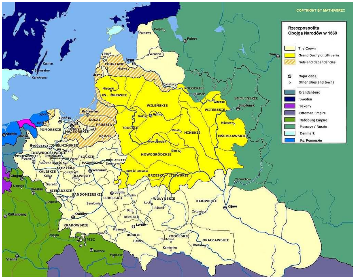
Rzeczpospolita Obojga Narodów w 1569 roku