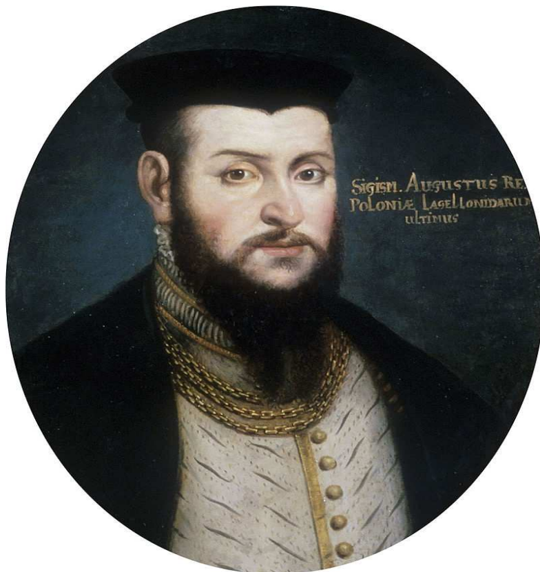
Zygmunt II August ok. 1554 roku

Gdy w roku 1548 rządy w państwie objął koronowany jeszcze za życia ojca, Zygmunta I Starego, Zygmunt II August, wobec jego bezpotomności wyraźnie dało się zauważyć dążenie do bardziej ścisłego związku obu państw, związanych dotąd wyłącznie osobą panującego. Przywódcy ruchu egzekucyjnego, Mikołaj Sienicki i Rafał Leszczyński, na kolejnych sejmach w 1548 i 1550 roku podnosili postulaty wcielenia Wielkiego Księstwa Litewskiego do Korony Królestwa Polskiego (co zakładała jeszcze unia w Krewie z roku 1385), Prus Królewskich, Księstwa Oświęcimskiego i Księstwa Zatorskiego. Na przeszkodzie unifikacji monarchii jagiellońskiej stała jednak odrębność ustrojowa i administracyjno-prawna państwa litewskiego. W 1551 roku powołano specjalną komisję, która zajęła się nowelizacją I Statutu Litewskiego z 1529 roku pod kątem reformy ustrojowej zbliżającej Wielkie Księstwo Litewskie do Królestwa Polskiego. W 1565 roku Zygmunt II August ustanowił sejmiki powiatowe, a w 1566 roku zatwierdził II Statut Litewski, w którym zrzekał się części swoich kompetencji na rzecz sejmu litewskiego, czym upodobnił go do sejmu koronnego.