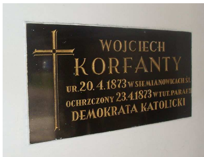
Tablica pamiątkowa ku czci Wojciecha Korfantego w kościele p.w. św. Krzyża w Siemianowicach Śląskich

Wojciech Korfanty urodzony jako Adalbert Korfanty 20 kwietnia 1873 roku w osadzie Sadowka (obecnie Siemianowice Śląskie), zmarł 17 sierpnia 1939 roku w Warszawie.