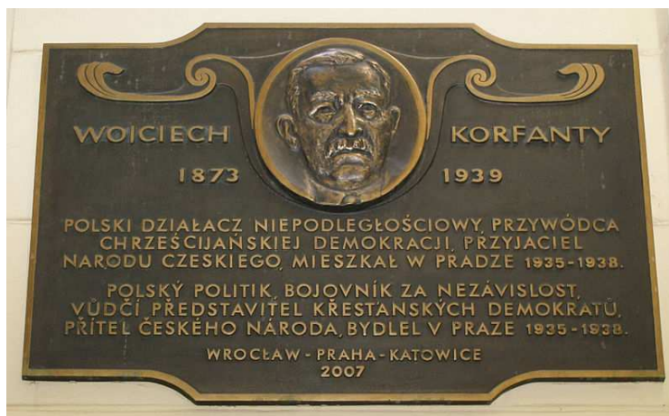
Tablica pamiątkowa w Pradze

Po aneksji Czechosłowacji wyjechał przez Niemcy do Francji. Pod patronatem Ignacego Paderewskiego wraz z gen. Władysławem Sikorskim, gen. Józefem Hallerem i Wincentym Witosem był założycielem Frontu Morges, a później organizatorem i prezesem Stronnictwa Pracy (połączenie Chadecji i Narodowej Partii Robotniczej). W kwietniu 1939 po wypowiedzeniu przez III Rzeszę układu o nieagresji i niestosowaniu przemocy, powrócił do Polski, jednak mimo chęci walki z Niemcami został aresztowany i osadzony na Pawiaku. Pomimo protestów opinii publicznej spędził tam prawie 3 miesiące. Ciężko chory, zwolniony został 20 lipca 1939. Zmarł 17 sierpnia 1939 roku. Pogrzeb Korfantego, na który przybyło ok. 5 tys. ludzi, stał się wyrazem poparcia dla prowadzonej przez niego polityki. Grób znajduje się na Cmentarzu przy ul. Francuskiej w Katowicach.