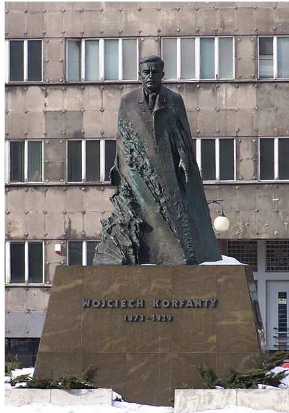
Pomnik Wojciecha Korfańskiego w Katowicach

W odrodzonej Polsce w latach 1922–1930 sprawował mandat posła na Sejm I i II kadencji. Związany był z Chrześcijańską Demokracją (ChD). W obliczu niepowodzenia misji stworzenia gabinetu Artura Śliwińskiego, 14 lipca 1922 został desygnowany przez Komisję Główną Sejmu RP na premiera rządu. Jednak wobec protestu swojego przeciwnika, naczelnika państwa Józefa Piłsudskiego i groźby przeprowadzenia strajku generalnego przez PPS, nie rozpoczął formowania rządu, a 29 lipca komisja wycofała jego desygnację.