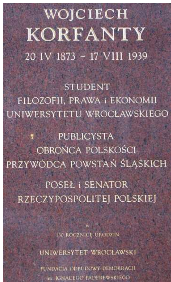
Tablica pamiątkowa w murach Uniwersytetu Wrocławskiego