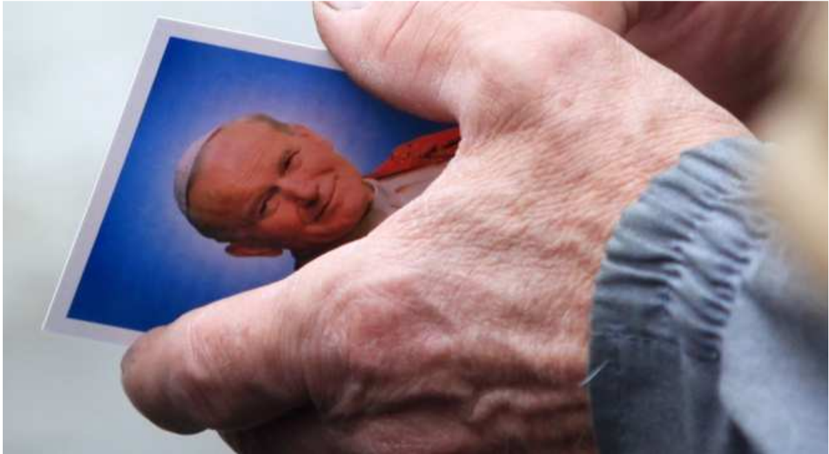
27 kwietnia 2014 r. papież Jan Paweł II został kanonizowany

Tłumy na ulicach miast. Ludzie zapłakani. Kwiaty, znicze. I to wszechobecne poczucie osamotnienia. Pytanie: co z nami będzie, kiedy Jego nie ma już wśród nas. To w największym skrócie wspomnienie nocy 2 kwietnia 2005 roku.