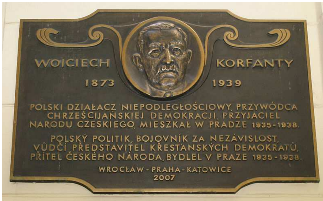
Tablica pamiątkowa w Pradze

Po aneksji Czechosłowacji wyjechał przez Niemcy do Francji. Pod patronatem Ignacego Paderewskiego wraz z gen. Władysławem Sikorskim, gen. Józefem Hallerem i Wincentym Witosem był założycielem Frontu Morges, a później organizatorem i prezesem Stronnictwa Pracy (połączenie Chadecji i Narodowej Partii Robotniczej). W kwietniu 1939 po wypowiedzeniu przez III Rzeszę układu o nieagresji i niestosowaniu przemocy, powrócił do Polski, jednak mimo chęci walki z Niemcami został aresztowany i osadzony na Pawiaku. Pomimo protestów opinii publicznej spędził tam prawie 3 miesiące. Ciężko chory, zwolniony został 20 lipca 1939. Zmarł 17 sierpnia 1939 roku. Pogrzeb Korfantego, na który przybyło ok. 5 tys. ludzi, stał się wyrazem poparcia dla prowadzonej przez niego polityki. Grób znajduje się na Cmentarzu przy ul. Francuskiej w Katowicach.