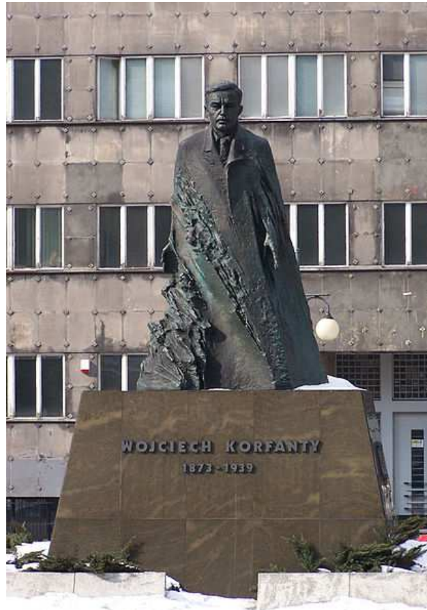
Pomnik Wojciecha Korfantego w Katowicach

W odrodzonej Polsce w latach 1922–1930 sprawował mandat posła na Sejm I i II kadencji. Związany był z Chrześcijańską Demokracją (ChD). W obliczu niepowodzenia misji stworzenia gabinetu Artura Śliwińskiego, 14 lipca 1922 został desygnowany przez Komisję Główną Sejmu RP na premiera rządu. Jednak wobec protestu swojego przeciwnika, naczelnika państwa Józefa Piłsudskiego i groźby przeprowadzenia strajku generalnego przez PPS, nie rozpoczął formowania rządu, a 29 lipca komisja wycofała jego desygnację.