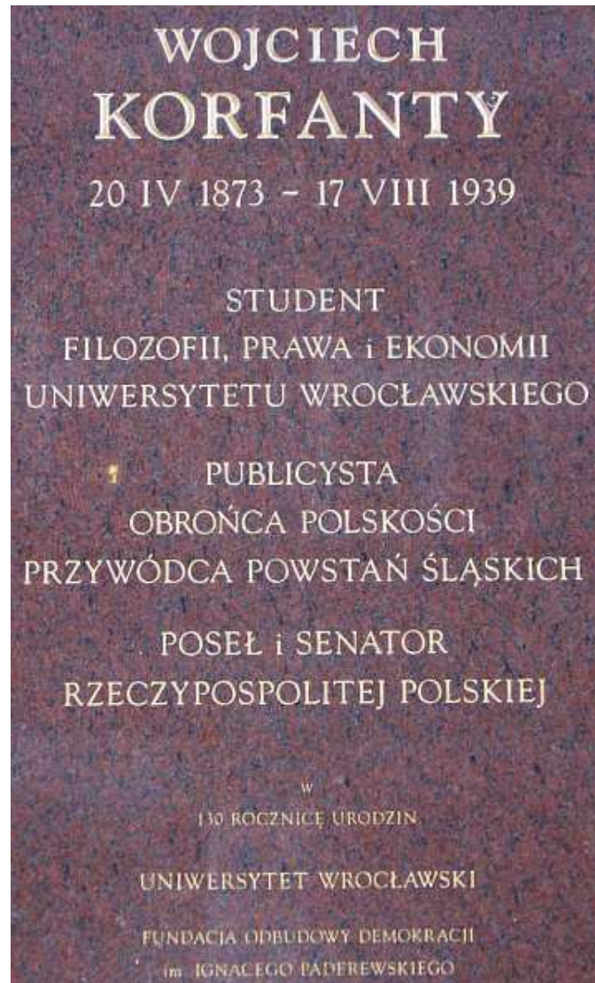
Tablica pamiątkowa w murach Uniwersytetu Wrocławskiego

co został relegowany 14 sierpnia 1895 z klasy maturalnej. Szkołę średnią ukończył w grudniu 1895, po interwencji Józefa Kościelskiego, posła do Reichstagu z Wielkopolski, jako ekstern i jeszcze w tym samym roku rozpoczął studia na politechnice w Charlottenburgu.