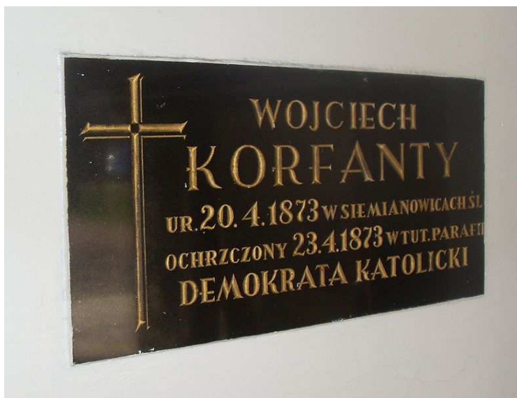
Tablica pamiątkowa ku czci Wojciecha Korfantego w kościele p.w. św. Krzyża w Siemianowicach Śląskich

Wojciech Korfanty urodzony jako Adalbert Korfanty 20 kwietnia 1873 roku w osadzie Sadowa (obecnie Siemianowice Śląskie),