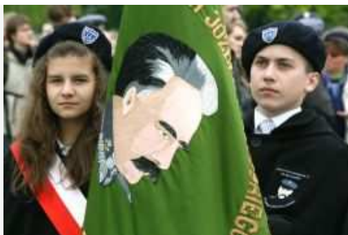
Na obchodach pojawili się uczniowie ze szkół noszących imię marszałka

W Warszawie odbyły się centralne obchody 78. rocznicy śmierci marszałka Józefa Piłsudskiego organizowane przez Związek Piłsudczyków we współpracy z Ministerstwem Obrony Narodowej i Urzędem do spraw Kombatantów i Osób Represjonowanych. Na placu jego imienia złożono wieńce pod grobem Nieznanego Żołnierza i pod pomnikiem marszałka. Dokonano też uroczystej zmiany warty wojskowej. W uroczystościach uczestniczyli przedstawiciele władz państwowych, władz stolicy i uczniowie szkół imienia Józefa Piłsudskiego oraz asysta honorowa Batalionu Reprezentacyjnego Wojska Polskiego i podchorążowie Wyższej Szkoły Oficerskiej Wojsk Łądowych z Wrocławia.