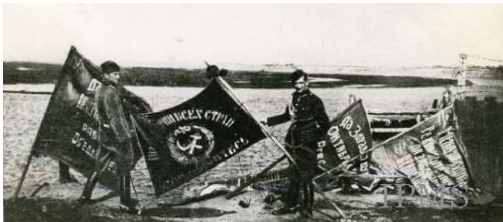
Po bitwie – polscy żołnierze ze sztandarami zdobytymi na bolszewikach.

sowieckich radiostacji nie mogła odebrać rozkazów. Warszawa bowiem na tej samej częstotliwości nadawała przez dwie doby bez przerwy teksty Pisma Świętego - jedyne wystarczająco obszerne teksty, które udało się szybko odnaleźć. Brak łączności praktycznie wyeliminował więc 4. Armię z bitwy o Warszawę.