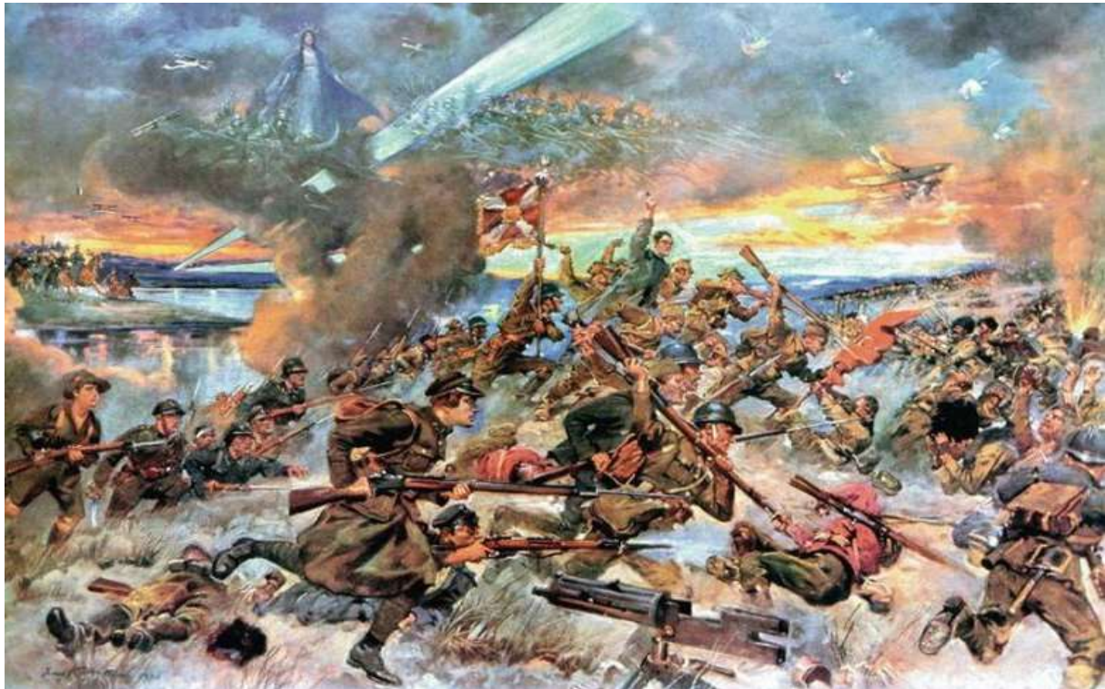
Cud nad Wisłą – obraz Jerzego Kossaka

Przełom w walkach, a tym samym - w wojnie polsko-bolszewickiej, nastąpił 15 sierpnia 1920, gdy armia polska pokonała wojska generała Michaiła Tuchaczewskiego atakujące stolicę.