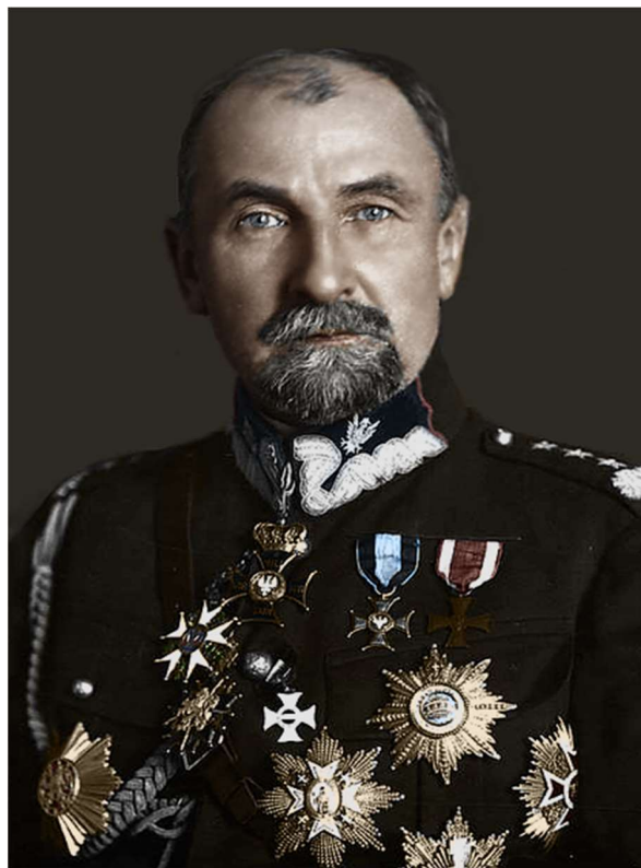
Generał Tadeusz Rozwadowski