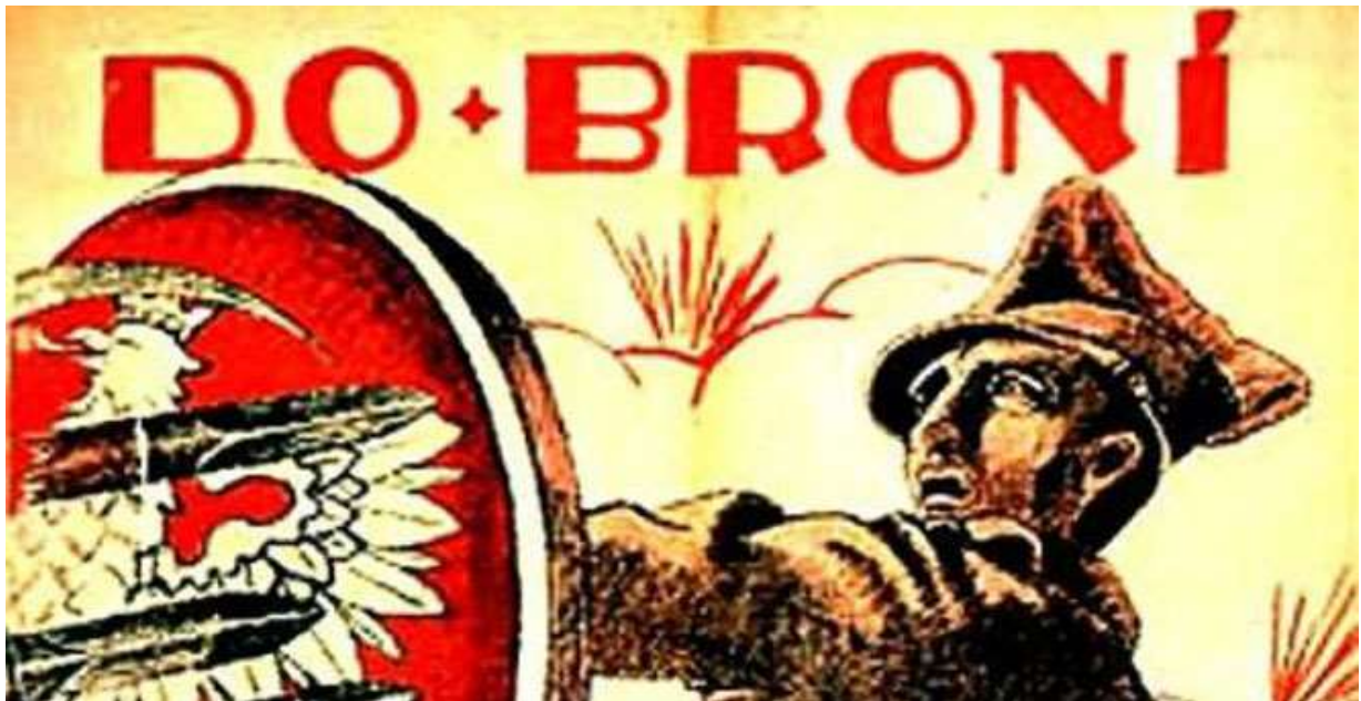
Plakat propagandowy z czasów wojny z bolszewią

W dniach 13-15 sierpnia 1920 na przedpolach Warszawy rozegrała się decydująca bitwa wojny polsko-bolszewickiej . Określana mianem "cudu nad Wisłą" i uznawana za 18. przełomową bitwę w historii świata zadecydowała o zachowaniu przez Polskę niepodległości i uratowaniu Europy przed bolszewizmem.