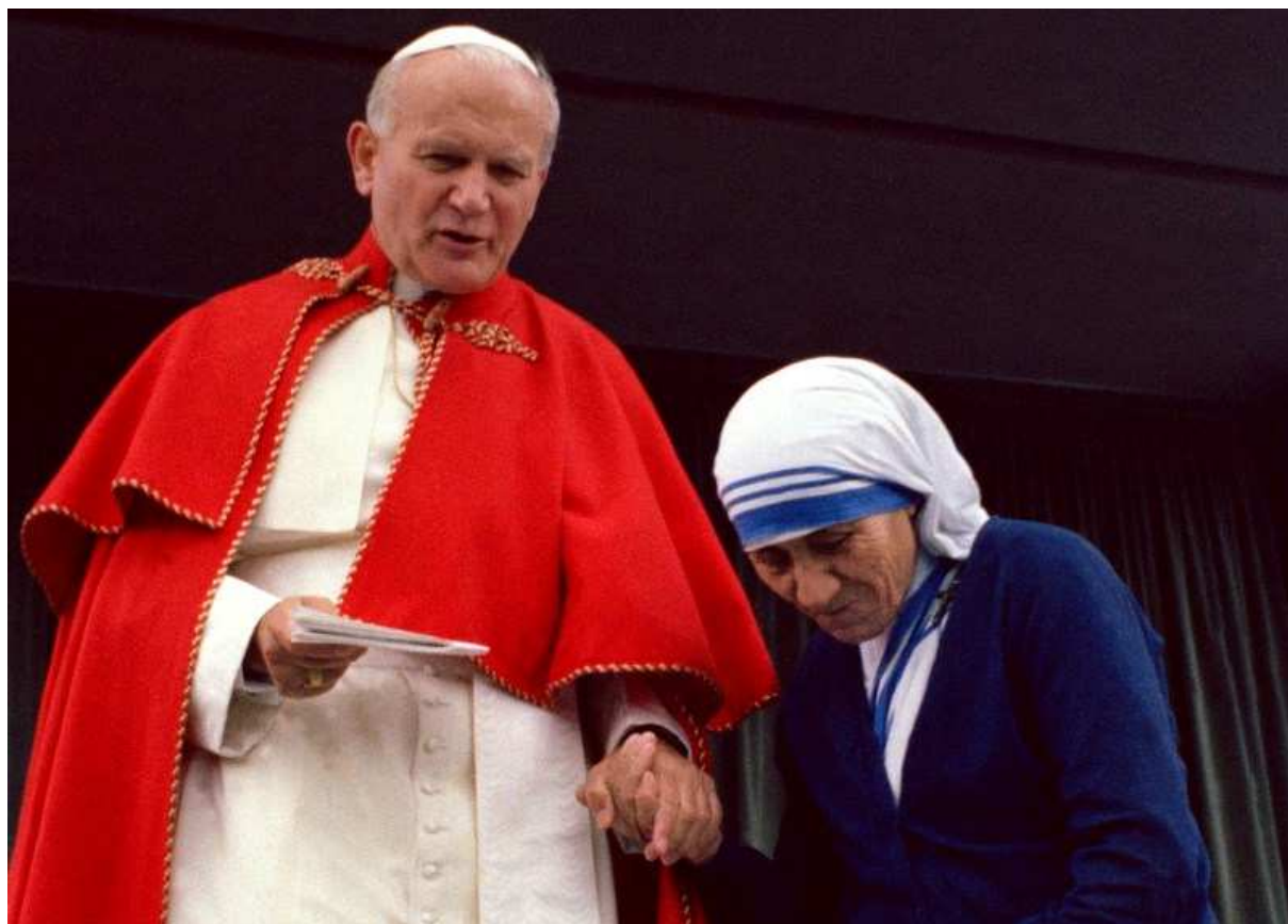
Ojciec Święty Jan Paweł II z Matką Teresą z Kalkuty

Jan Paweł II wielokrotnie przypominał, że człowiek jest stworzony na podobieństwo Boga, czyli jest zdolny do miłowania i przyjmowania daru miłości. Często apelował do wiernych, aby nie wstydzieli się własnej wiary i podkreślał jej znaczenie w życiu współczesnego człowieka. Nazwany papieżem pielgrzymem, Jan Paweł II odbył 104 podróże zagraniczne, odwiedzając 130 krajów. Ponadto odbył 145 podróży po Włoszech. Jako papież, dziewięciokrotnie odwiedził Polskę. Ostatnią pielgrzymkę do kraju, w 2002 roku, Jan Paweł II poświęcił Bożemu Miłosierdziu, któremu powierzył Ojczyznę.