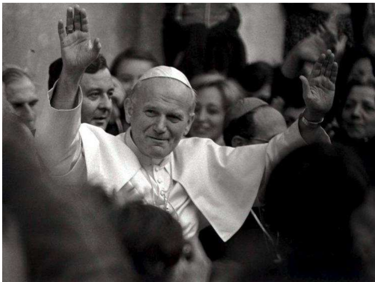
Papież Jan Paweł II podczas pierwszego oficjalnego publicznego wystąpienia w Castel Gandolfo. 1978.

Przesłaniem pontyfikatu Jana Pawła II stały się słowa wygłoszone w homilii podczas mszy inauguracyjnej, odprawionej 22 października 1978 roku: "Nie lękajcie się! Otwórzcie drzwi Chrystusowi!"